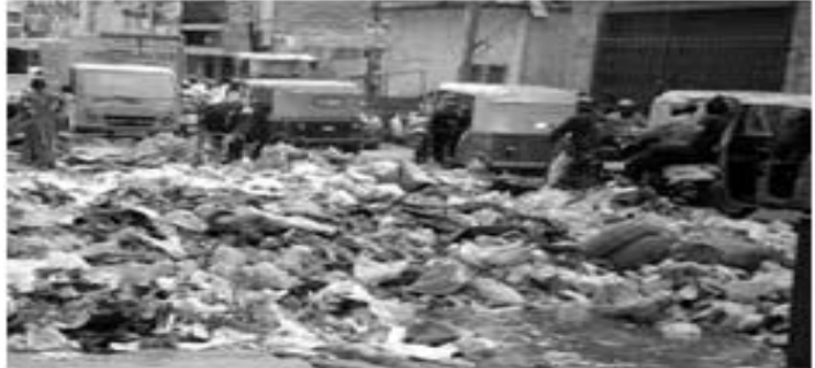
ಸ್ವಚ್ಛತೆ ಎಂದರೆ ಕಸವನ್ನು ಒಂದು ಕಡೆ ಸೇರಿಸುವುದಲ್ಲ ಉತ್ಪತ್ತಿಯ ಪ್ರಮಾಣವನ್ನು ಕಡಿಮೆ ಮಾಡುವುದು ಸುನೀಲ್ ಬಿ ಎನ್